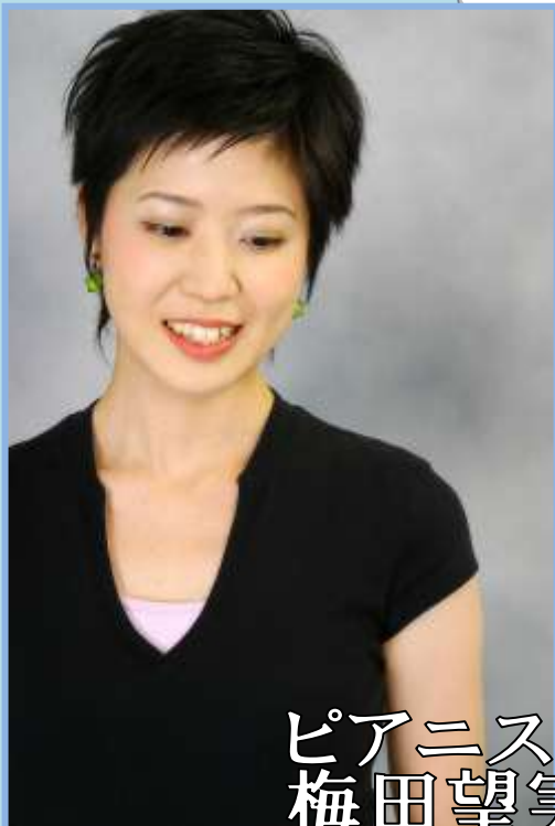
ピアニスト 梅田望実